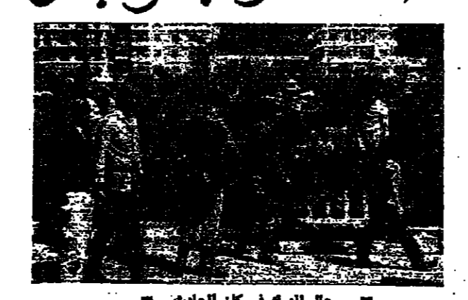
رجال الدرك في مكان الحادث

طرابلس - من مكتب «الاتوار»: سقط جريح في حادث إطلاق نار بطرابلس بعد ظهر امس، برصاصة اطلقتها عليه مسلح كان يسير سيارة بوبك زرقاء، قرب منزل طرابلس الجنوبي، بينما كان مع عدد من رفاقه يتناولون الطعام.